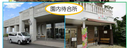
第一霊園：礼拝堂前