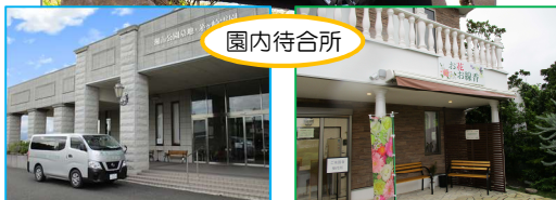
第一霊園：礼拝堂前