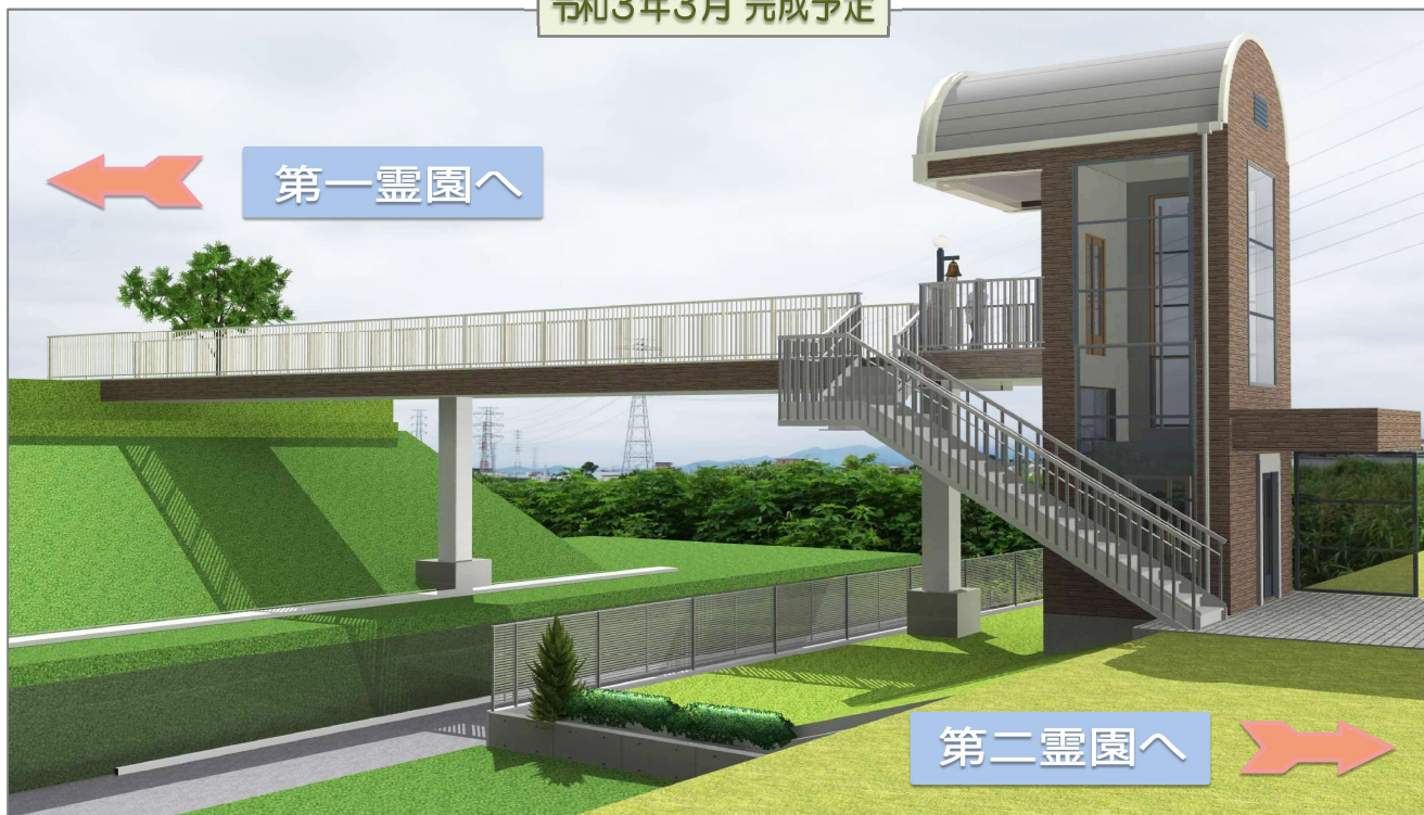
※完成予想図の為、実際とは多少異なります。